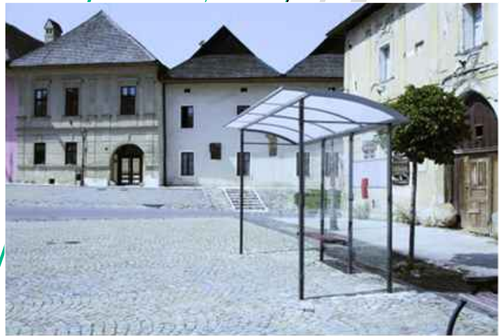
Ilustrační foto navrhovaného typu přístřešku - SKANDUM 100a