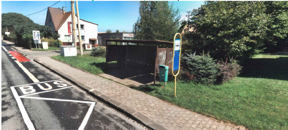
Původní plechový přístřešek