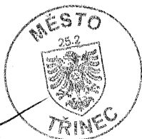
za poskytovatele RNDr. Věra Palkovská