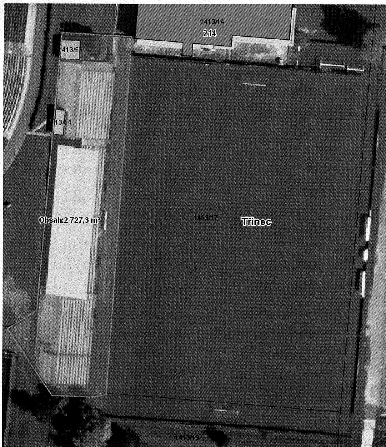
Příloha č. 1 ke smlouvě č. 2016/06/01/Ka – situační snímek