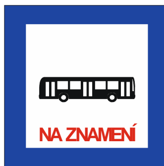
Obrázek č. 5: Vzor značky doplněné o text „NA ZNAMENÍ“ dle bodu 4.2 a) tohoto článku v případě užití na zastávce na znamení dle bodu 2.1 článku 2