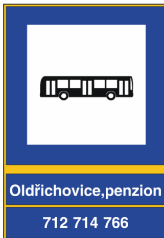
Obrázek č. 2: Vzor zastávkové hlavy

Rám vyveden v barvě RAL 1028 – žlutá melounová.