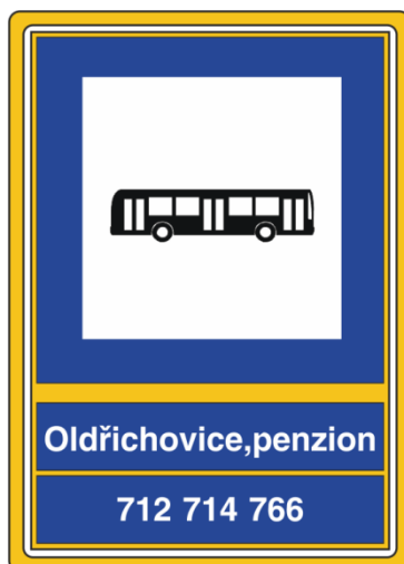
Obrázek č. 3: Vzor zastávkové hlavy doplněné o tzv. pomocný rám

Pomocným rámem se myslí zaoblená trubka obepínající zastávkovou hlavu vyobrazenou na Obrázku č. 2.