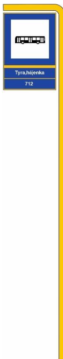
Obrázek č. 1: Vzory jednoramenných zastávkových sloupků