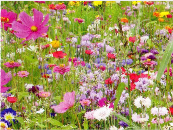
LETNIČKOVÁ SMĚS VÝŠKY 50-80 cm, DOUCE FRANCE